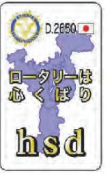
2014-2015 第2650地区テーマ ロータリーは心くぼり